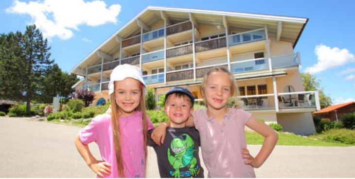
Die Celenus Fachklinik Bromerhof